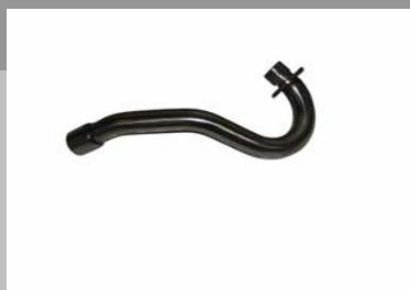
Artikel Nr. SET 7

45mm Edelstahl Rohre mit eingeschweißten Konus am Anfangstück des Krümmers. Erreichen Sie eine Leistungssteigerung bis zu 3 PS über den ganzen Drehzahlbereich. Sehen Sie unsere Test am T1 Leistungsprüfstand!