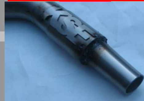
Alten Krümmer kürzen und unser Teil aufschweißen

Teil: 1 Konisch 28mm auf 34mm Ende 45mm Teil: 2 30 Grad 45mm Aussendurchmesser Teil: 3 45 Grad 45mm Aussendurchmesser Teil: 4 Anschluss für Eigenen Endschalldämpfer Anfang 48mm Aussendurchmesser Ende 58mm Aussendurchmesser Scheibe Aussen 90mm mit 4 Löchern 5mm