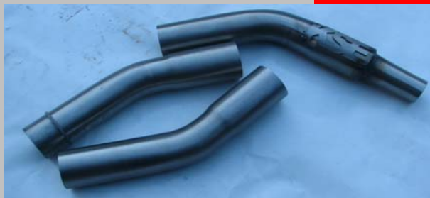
Artikel Nr. SET 1

Teil: 1 Konisch 28mm Anschluss auf 34mm Teil: 2 30 Grad 45mm Aussendurchmesser Teil: 3 45 Grad 45mm Aussendurchmesser