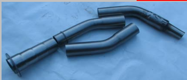
Artikel Nr. SET 2

Teil: 1 Konisch 28mm auf 34mm Ende 45mm Teil: 2 30 Grad 45mm Aussendurchmesser Teil: 3 45 Grad 45mm Aussendurchmesser Teil: 4 Anschluss für Eigenen Endschalldämpfer Anfang 48mm Aussendurchmesser Ende 58mm Aussendurchmesser Scheibe Aussen 90mm mit 4 Löchern 5mm