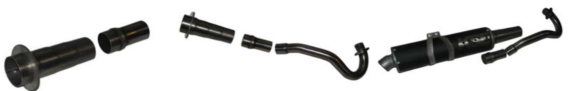
Artikel Nr. SET 3

2 Teiliges Krümmer Set Anfang Stück 38mm Endstück Konisch